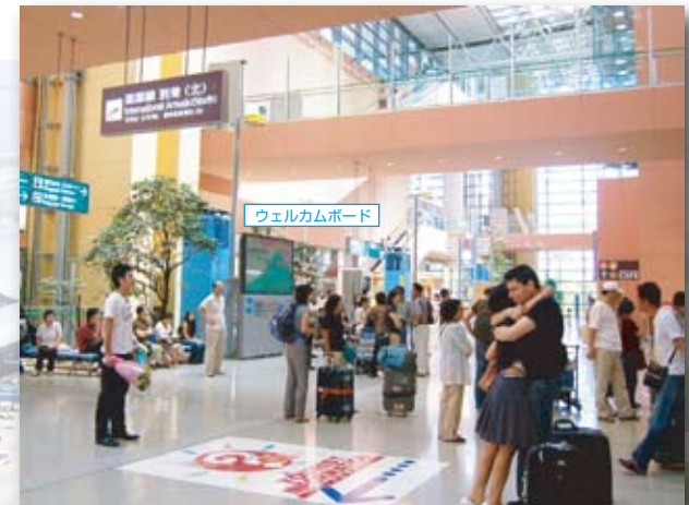
国際線北到着ロビー